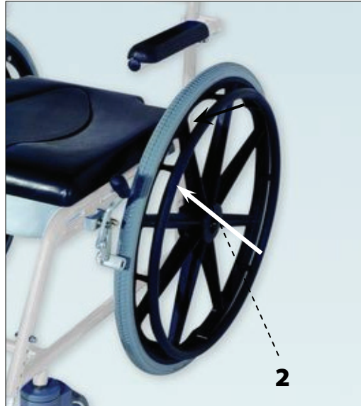
Připevnění zadních kol