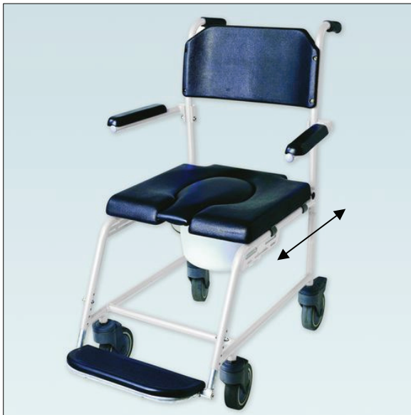
Vysunutí/zasunutí plastové nádoby

Pro použití křesla k toaletě sundejte centrální odnímatelnou část a odstraňte víko plastové nádoby. Nádobu pak lze vysunout z držáků pod sedákem směrem dozadu.