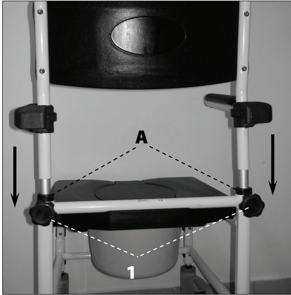
Nasazení opěrky zad

Vyjměte z krabice rám křesla s kolečky. Vyšroubujte šrouby (1) na zadní straně, spodní část trubek opěrky zad zasuňte do otvorů v rámu křesla (A) a šrouby (1) dotáhněte. U modelu 4145 připevněte zadní kola stisknutím plastové krytky pojistky rychloupínacího zámku ve středu kola (2), kola zasuňte a zacvakněte do úchyťů. Nyní je křeslo připraveno k použití.