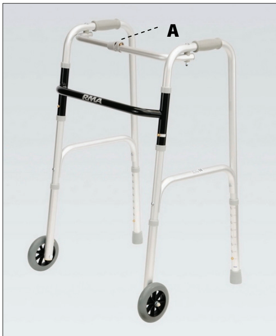
Bezpečnostní pojistka složení rámu.