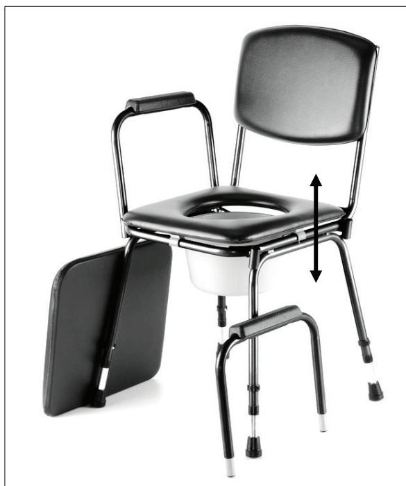
Vysunutí područky (513 S)