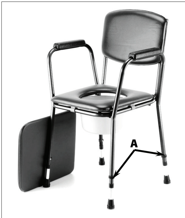
Umístění aretačních pojistek

Pro nastavení výšky křesla vyjměte aretační „E“ pojistku (A) a tahem/tlakem nastavte požadovanou délku nohy. Ve zvolené poloze pojistku zasuněte zpět. Tento postup opakujte u všech čtyř nohou.