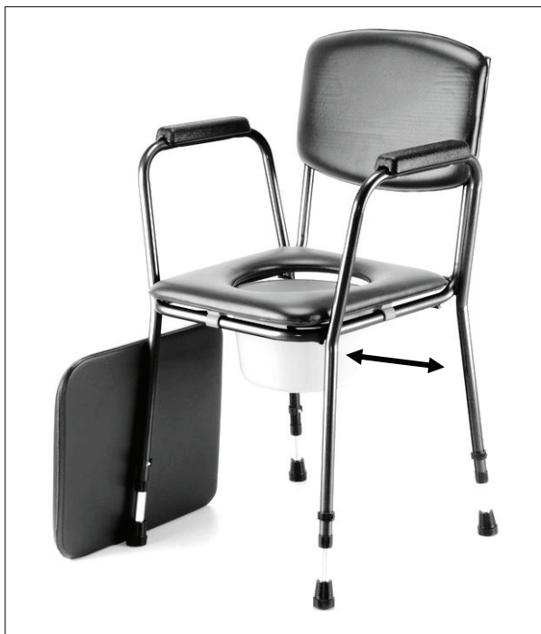
Vysunutí/zasunutí plastové nádoby

Pro použití křesla sundejte polstrovaný sedák a odstraňte víko plastové nádoby. Nádoby pak lze vysunout z držáků pod hygienickým prkénkem do pravé nebo levé strany. U modelu 513S lze tahem nahoru velmi jednoduše vysunout područku pro lepší nasedání.